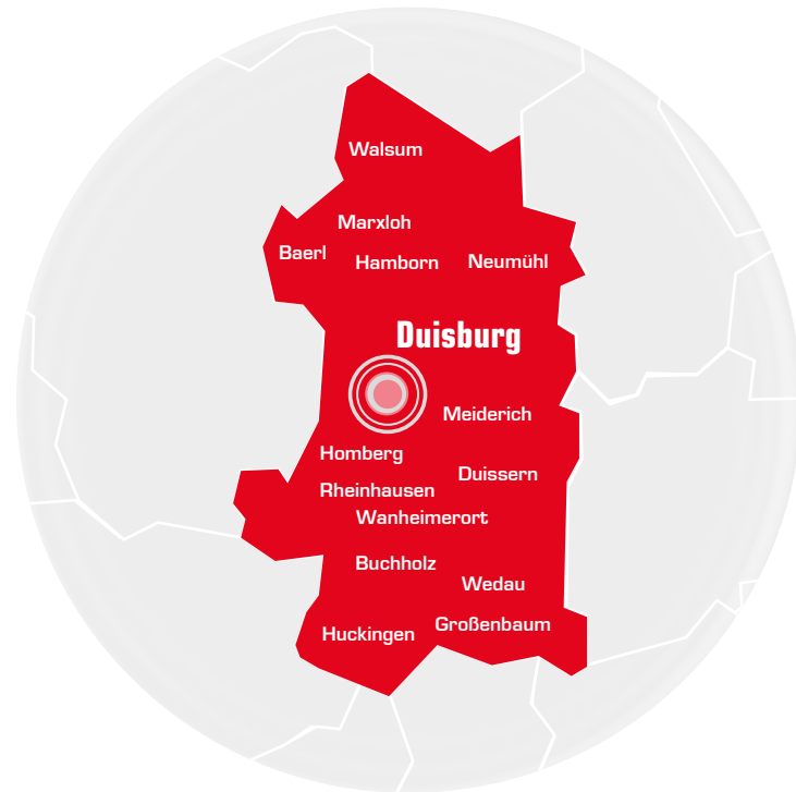
Verbreitungsgebiet Radio Duisburg